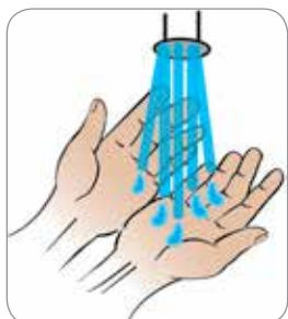
Navlažiti ruke vodom Gacmahaga biyo yar ku maydh