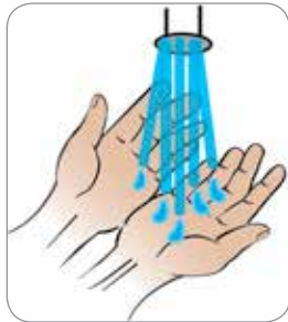
Hände anfeuchten Rinse your hands with water