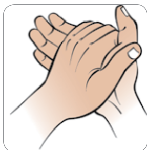
Trljati ruku jednu o drugu 20-30 sekundi 20-30 il-bidhiqsi is dul marmari gacmahaga