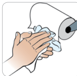
Thani duart Sécher les mains