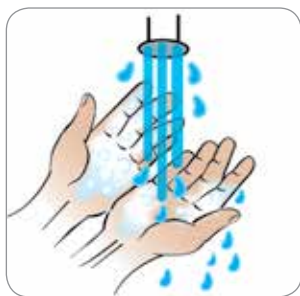
Shpëlani mirë sapunin Rincer bien les mains