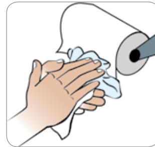
Hände abtrocknen Dry your hands