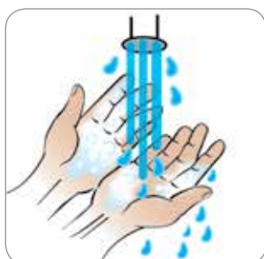
Sapun dobro isprati Saabuunta iska maydh