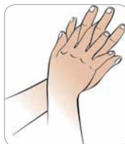
Između prstiju takođe Ilaa faraha dhexdooda mari